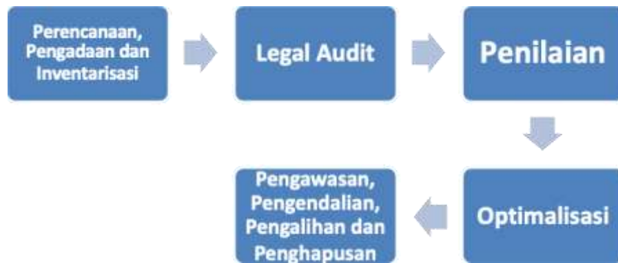
Gambar 3.1 Alur Proses dalam Manajemen Sarana dan Prasarana

Organisasi manajemen prasarana dan sarana tidak terlepas dari proses-proses yang berlangsung di dalamnya sebagai sebuah sistem. Salah satu bagian penting dalam manajemen prasarana dan sarana perguruan tinggi adalah manajemen prasarana dan sarana pendidikan. Keberadaan prasarana dan sarana tersebut sangat menentukan keberhasilan proses pendidikan. Setiap pengelolaan sarana prasarana perlu menempuh alur tahap demi tahap yang sistematis dan menyeluruh. Tahap-tahap dalam alur dalam manajemen sarana dan prasarana dapat digambarkan sebagai berikut.